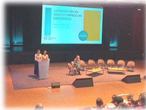
Introduction de la journée

Le 16 novembre, l'équipe ETP a organisé une journée dédiée à la coopération en santé et aux approches innovantes au Palais des Congrès à Lorient. Nous retenons l'enthousiasme de toutes et tous à venir participer à cette journée, la qualité des interventions proposées par nos invités, la richesse des échanges et des rencontres mais et surtout l'engouement sincère de toutes et tous pour la coopération en santé !